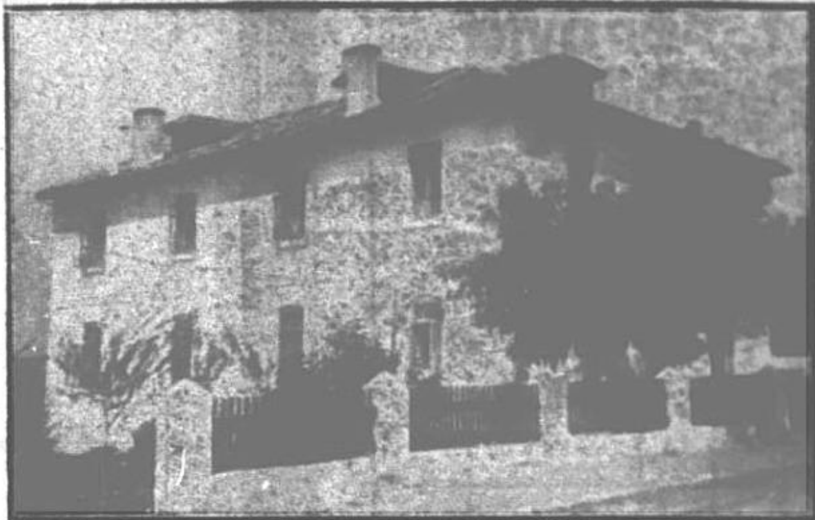
TECHIRGHIOI.—Vila Cristina și Băile Moderne