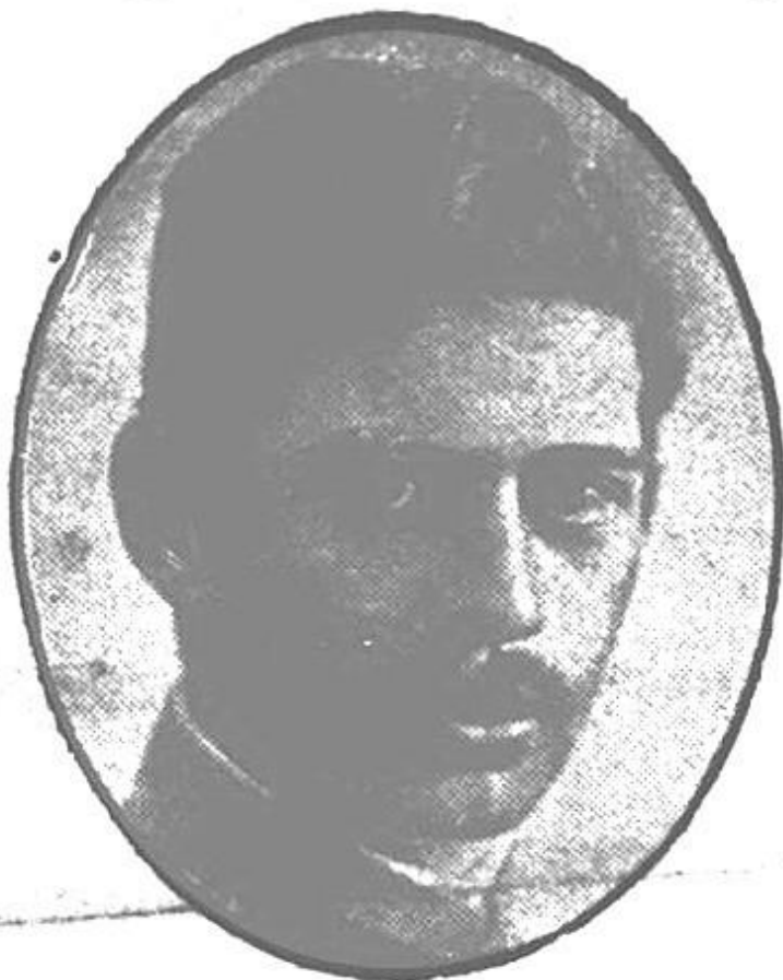
M. S. Regele Carol al II-lea

Suntem informați că în prima jumătate a lunii August, M. S. Regele Carol al II-lea, va veni la Constanța, luând reședința la palatul regal dela Mamaia.